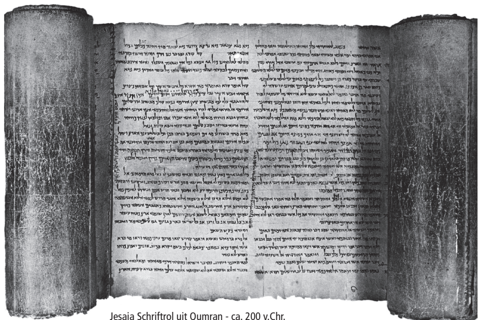
Jesaja Schriftrrol uit Qumran - ca. 200 v.Chr.

Er zijn zeker nog veel meer punten te noemen waar de betekenis van het kruis anders geïnterpreteerd kan worden. Wat mij in deze kwestie tot de overtuiging gebracht heeft dat er wel een verband ligt tussen het kruis van Jezus en mijn leven, hangt onder meer samen met een profetische tekst uit Jesaja 53. Honderden jaren voor Christus schrijft Jesaja over het lijden, sterven en de opstanding van een zekere 'Knecht van de