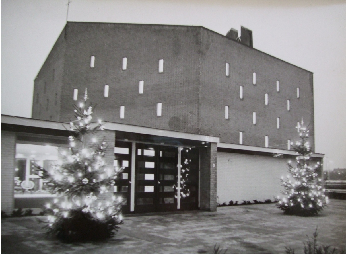
De ingang van de Adventskerk bij de ingebruikname op 9 december 1960